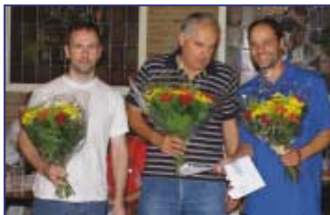
De nr's 1, 2 en 3 van het slottoernooi.